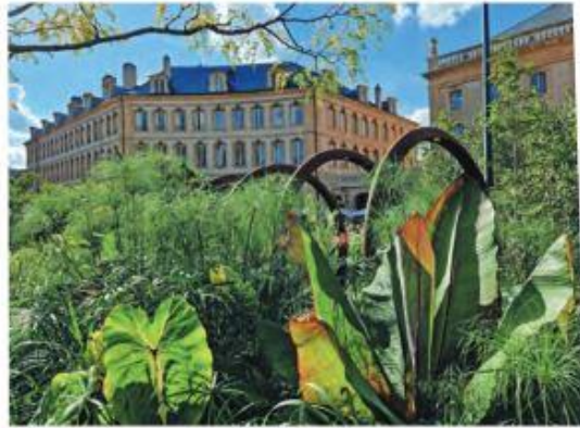
2 e prix > ANDRÉ SCHMITT Amicale des Diagonalistes de France Éclats de vert

Le photographe montre ici l'interpénétration de la nature dans la ville pour offrir sa perception de la chose dans une mise en scène où la chlorophylle et le végétal rejettent la ville au second plan. Il ne s'agit pourtant que d'une photo. Il a suffit de plier les genoux pour lui donner cet angle particulier.