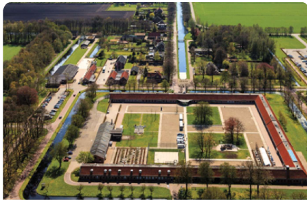
Colonie de charité Veenhuizen Patrimoine mondial de l'UNESCO

Le nombre de participant(e)s pouvant être accueillis dans de bonnes conditions est fixé à 1 500 personnes , dès ce quota atteint, les inscriptions seront fermées.