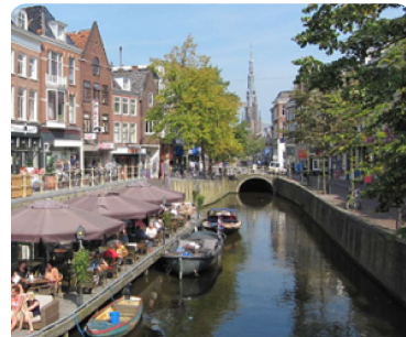
Leeuwarden - capitale de la Frise